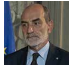
Giovanni Grasso Consigliere per la stampa e la comunicazione del Presidente della Repubblica