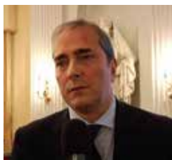
Enzo d'Errico direttore del Corriere del Mezzogiorno