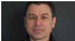
Grigory Pasko 2019

Premio Ischia Internazionale Grigory Pasko