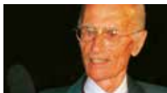
Indro Montanelli 1997

Premio Ischia Internazionale Indro Montanelli