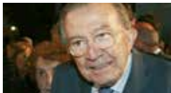
Giulio Andreotti 1987

Premio Ischia Internazionale Giulio Andreotti (Italia)