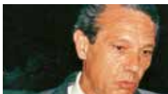
Joaquín Navarro Valls 1988

Premio Ischia Internazionale Joaquín Navarro Valls (Spagna)