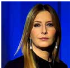
Barbara Carfagna Conduttrice e autrice di Codice, la vita è digitale