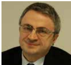
Luigi Fiorentino Capo dipartimento editoria Presidenza del consiglio