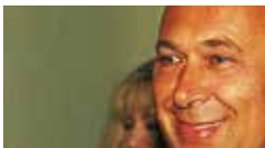
Paolo Mieli 2000

Premio Ischia Internazionale Paolo Mieli