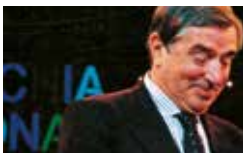
Demetrio Volcic 1992

Premio Ischia Internazionale Demetrio Volcic (Italia)