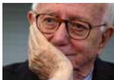
Enzo Biagi 1986

Premi speciali Tana De Zulueta (Columbia)