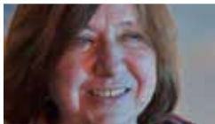
Sviatlana Aleksivich 2017

Premio Ischia Internazionale Sviatlana Aleksievic (Bielorussia) e Anthony Loyd (Regno unito)