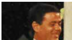
Ezio Mauro 1994